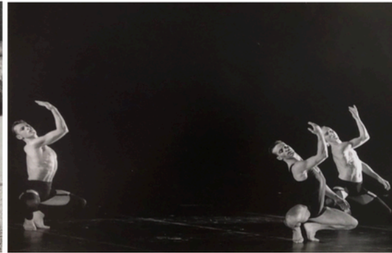
Anglos (1990). Coreografía Allain Gruttadauria.