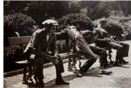
Parados (1988). Coreografía Airton Tenorio.